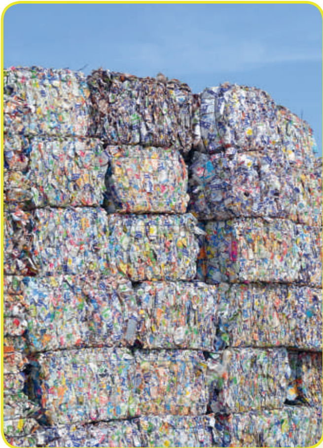
Geperste en gebalde drankenkartons.

na 2013. Onduidelijk is of de inzameling van drankenkartons dan zal worden voortgezet. De hoofdplicht voor het KIDV (Kennisinstituut Duurzaam Verpakken) is om de hoogst haalbare doelen voor 'reduce, re-use, recycle' vast te stellen voor 2018 en 2022. Onderdeel daarvan is bijvoorbeeld de hoogte van de vergoeding die gemeenten voor de inzameling krijgen, als besloten wordt na de pilotperiode door te gaan met inzamelen van de drankenkartons.