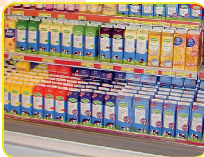
Melkpakken in de winkel: een goed te recyclen verpakking.

en karton is 75 procent. Die doelstelling wordt al ruimschoots behaald met de bestaande inzamel- en recyclingstructuur wat als nadelig gevolg heeft dat een belangrijke prikkel ontbreekt om ook drankkartons gescheiden in te zamelen. In aanloop naar het Verpakkingenakkoord dat het bedrijfsleven en het Ministerie van Infrastructuur en Milieu vorig jaar sloten, hoopte de stichting Hedra (behartigt de milieubelangen van drankkartons) dat de drankkartons in het nieuwe akkoord een aparte vermelding zouden krijgen. Helaas