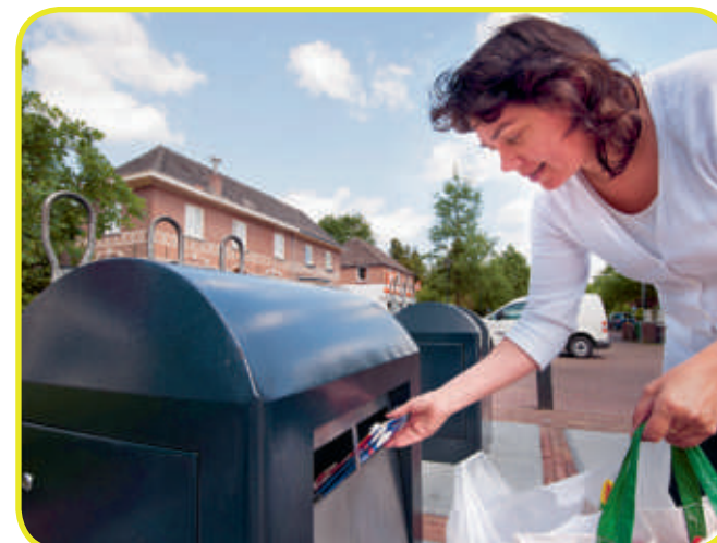
Het gescheiden aanleveren van drankpakken in de gemeente Bronckhorst.